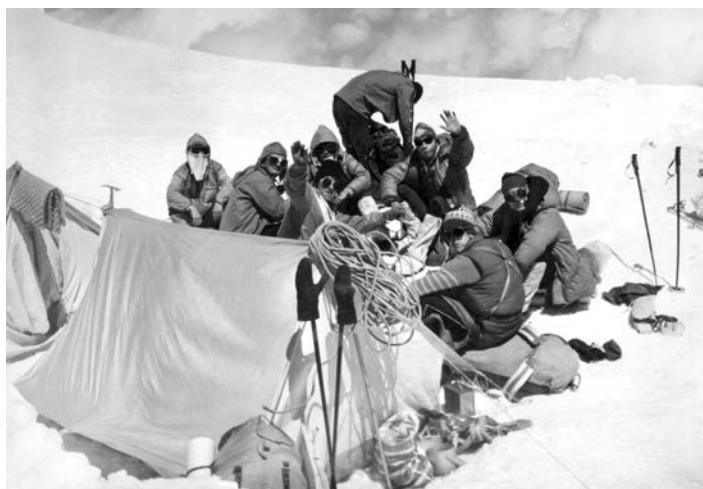
Горняки – покорители Эльбруса и основатели альпинизма на Урале, 1934 г.