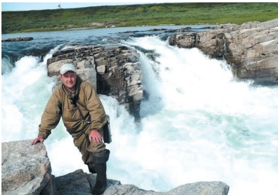
В полевых экспедициях ученые-геологи УГГУ проводят 1,5-2 месяца ежегодно.

С 2000 года экспедиция начала работы в рамках федерального заказа Министерства природных ресурсов РФ по геологическому доизучению и подготовке Государственной геологической карты масштаба 1:200000 (Госгеолкарты-200) группы листов Полярного Урала