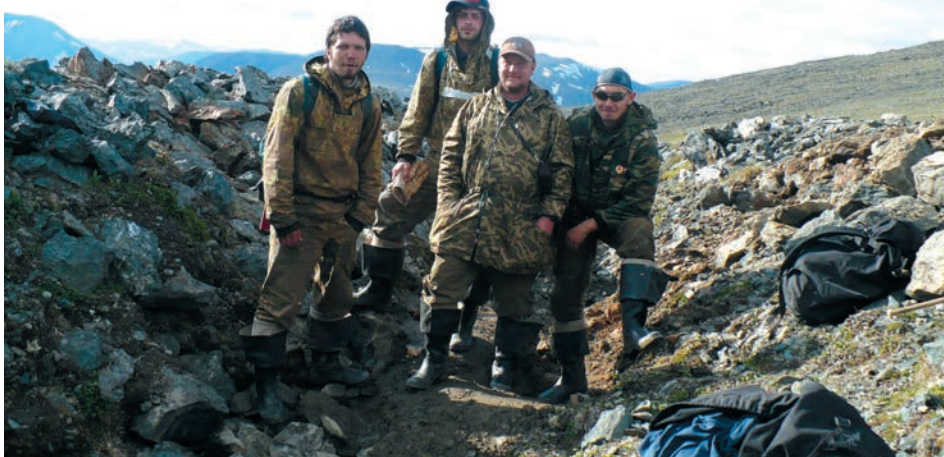
Костер, палатка, маршруты – вот романтика будней геологов. На снимке: преподаватели и студенты кафедры геологии, поисков и разведки месторождений полезных ископаемых УГГУ в геологических маршрутах

от побережья Байдарацкой губы и почти до г. Лабитнанги. Дальше геолого-съёмочные работы продолжились на Приполярном Урале. На сегодняшний день изданы все комплекты карт исследованных площадей. Сейчас мы выполняем работы на Среднем Урале.