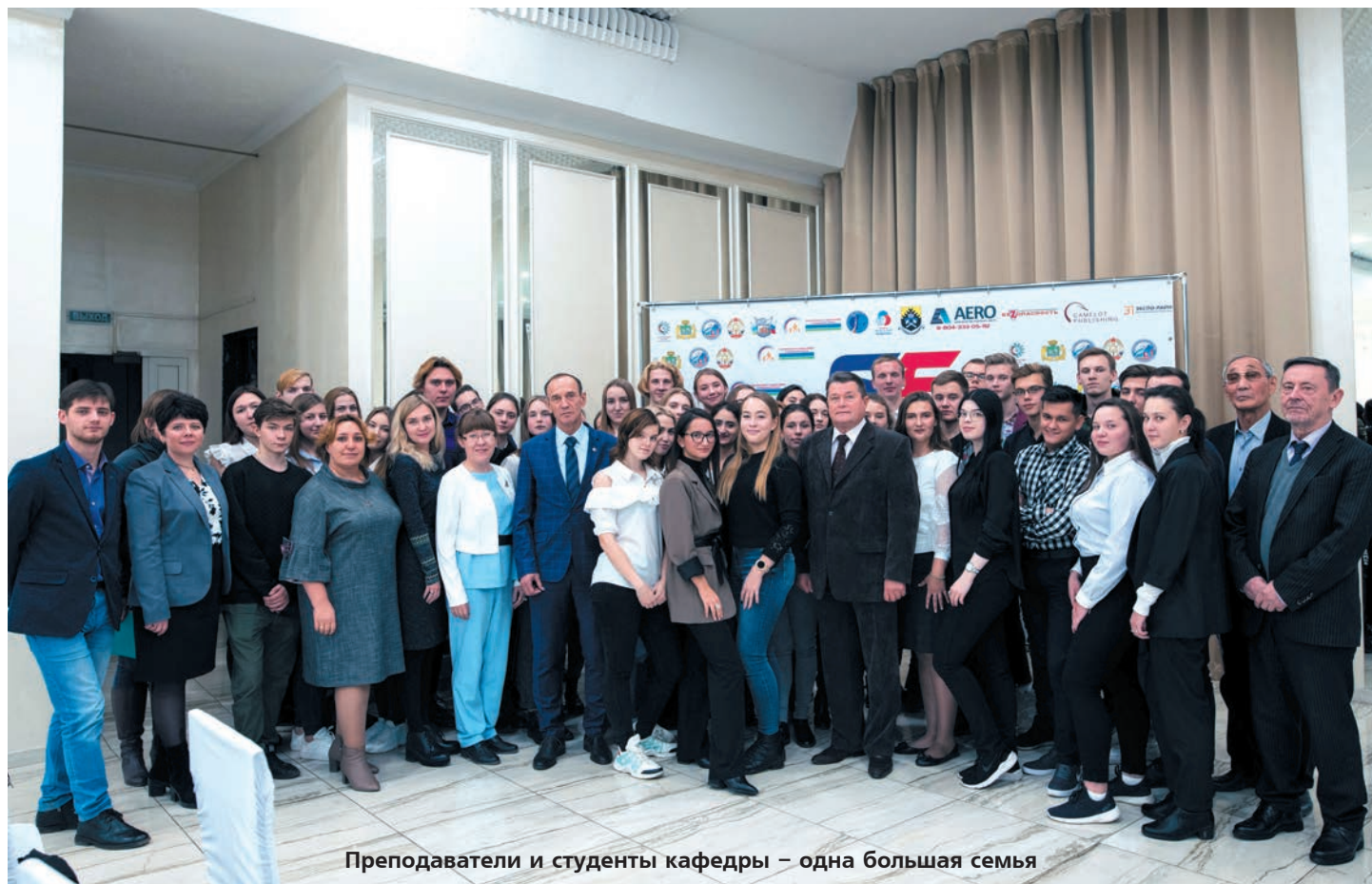
Преподаватели и студенты кафедры – одна большая семья

15-летие кафедра ГЛЗЧС отметит в декабре. Отпраздновать юбилей сотрудники собираются так, как привыкли работать: большой компанией, дружно и весело.