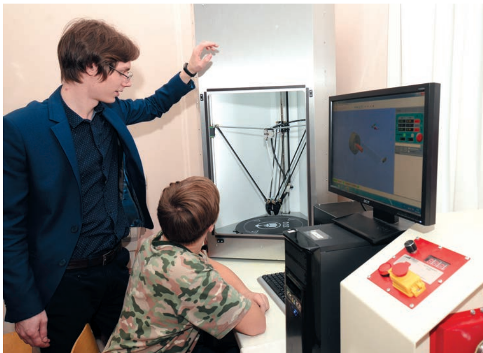
На занятиях со школьниками, посвященных изучению работы 3-D принтера

В будущем горняк планирует принять участие в создании конструкторского бюро при кафедре эксплуатации горного оборудования для студентов и школьников, где они могли бы совместно реализовывать технические проекты.