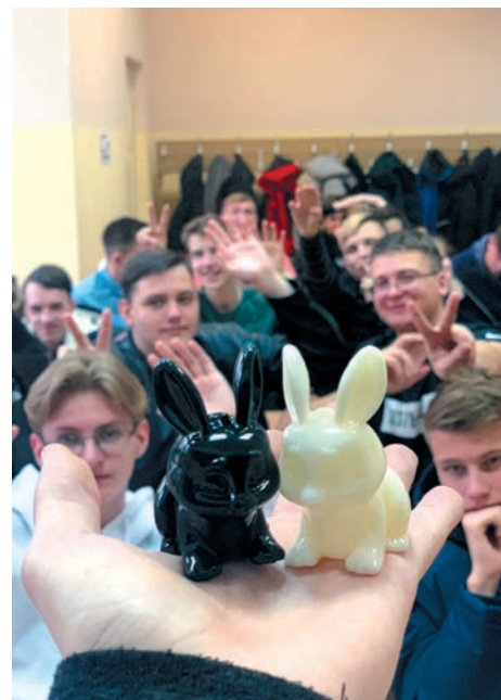
В результате получаются не только различные технические детали, но и такие милые изделия