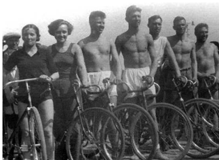
Участники легендарного велопробега, 1935 г.